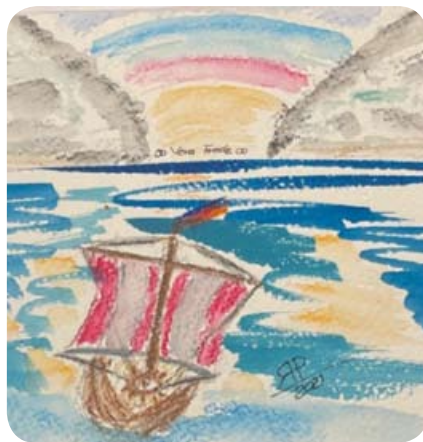
Rainer H. Porschien: „Die letzte Große Fahrt“ (Aquarell, 2021).

Seit 17 Jahren arbeite ich hauptberuflich in der Medizinischen Notrufzentrale in Basel. Das ist eine Stiftung, von Ärzten vor mehr als